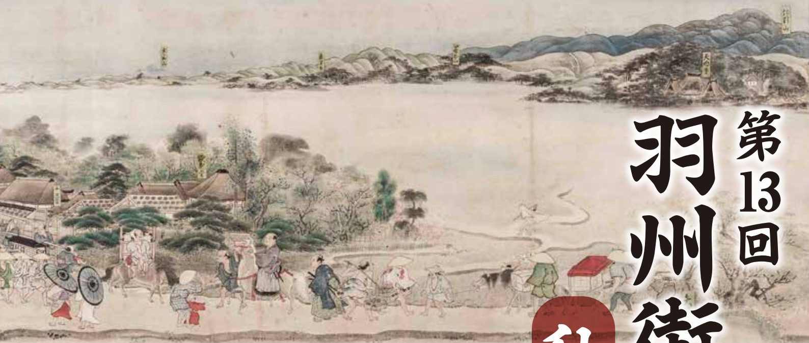
「秋田街道絵巻」より八橋<部分> (秋田市立千秋美術館蔵)